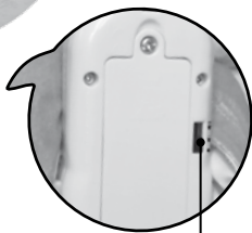
Curseur Marche/ Arrêt/Réglage du volume sonore